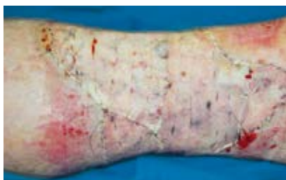
Voorbeeld: dag 5 postoperatief (Ghosting-effect)

Het uiterlijk van de wond is mogelijk niet zo roze als alleen bij STSG (Ghosting Effect). Het vermoeden zou kunnen zijn dat het transplantaat niet is ingenomen. Op dag 5 begint de vascularisatie echter, maar MatriDerm® Dermal Matrix is nog niet volledig omgezet in huidweefsel. Daarom kan de wond er bij de eerste verbandswisseling bleek uitzien, maar de genezing verloopt normaal. Beoordeel de wond opnieuw bij de volgende verbandswissel.