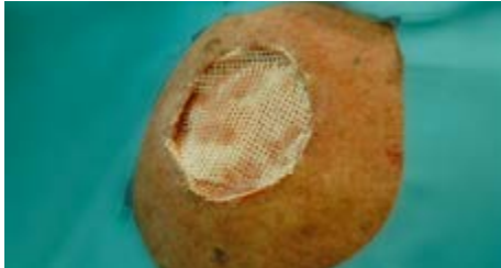
Voorbeeld: plaatsing van niet-klevend verband bovenop STSG