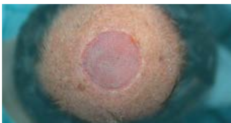
Voorbeeld: Wond na 12 dagen