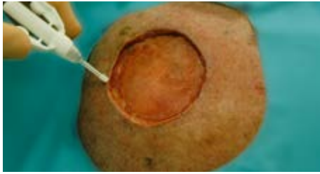
Voorbeeld: fixatie van STSG met histoacryl weefsellijm