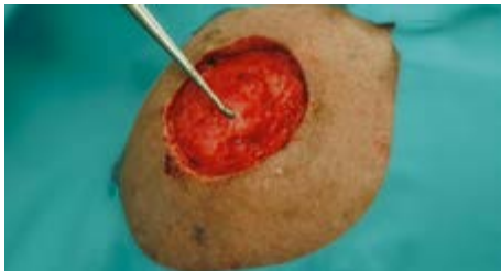
Voorbeeld: wondbed na excisie van nodulair maligne melanoom op de hoofdhuid en 7 dagen NPWT