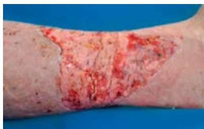
Voorbeeld: dag 14 postoperatief (graft voor 95% aangeslagen)