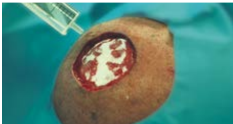
Voorbeeld: rehydratie van MatriDerm® Dermal Matrix