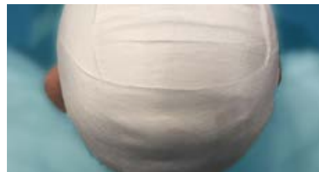
Voorbeeld: Fixatie met strak verband