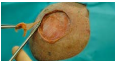
Voorbeeld: bijsnijden van STSG